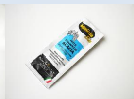
アカシアの有機ハチミツ