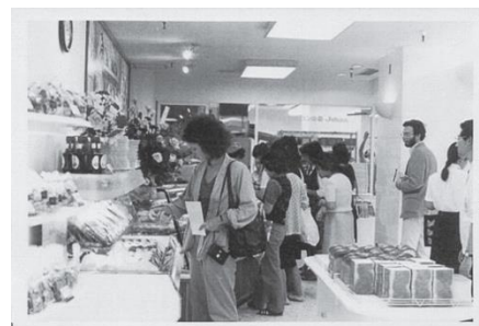
▲銀座ジョアン店オープン時の様子

フランスの伝統的なパンや菓子、本格的な食事パンをはじめ、焼きたての人気の高いパンなどを毎日職人が店内の厨房で焼き上げています。