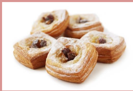
【9月限定】プチマロン (303 円)

サクサクしていてほんのり甘い 小さなクロワッサン。 ミニワン定番の人気商品です。