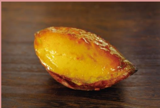
スイートポテト (292 円/100g)

さつまいもの皮を器にしているのが特徴。 さつまいもの優しい甘さとなめらかな くちどけが楽しめるスイートポテトです。