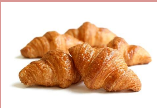
ミニクロワッサン (195 円/100g)

サクサクしていてほんのり甘い 小さなクロワッサン。 ミニワン定番の人気商品です。